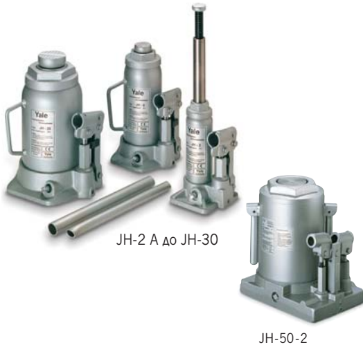
JH-2 A до JH-30