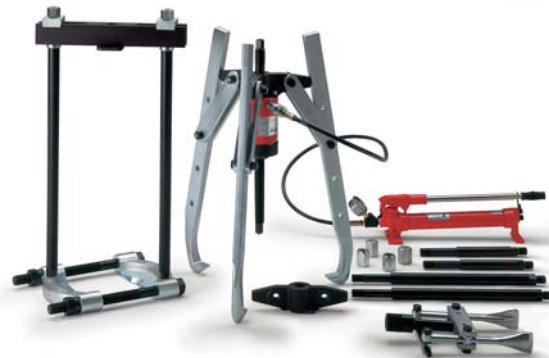
YHP-2752 G YHP-3752 G YHP-5752 G