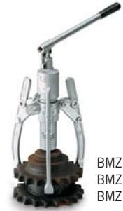
BMZ-6 BMZ-8 BMZ-11